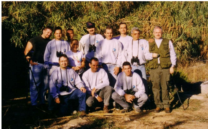
Componentes del grupo local de SEO/BirdLife y grupo de anillamiento Chagra durante la celebración del Día Mundial de las Aves de 1991