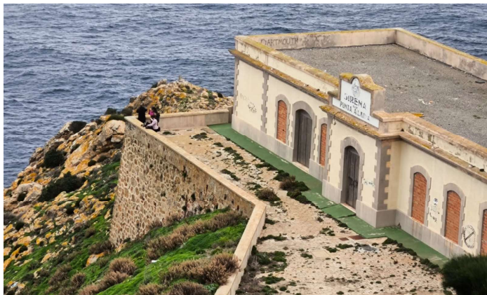
La Sirena de Punta Blanca un lugar idóneo para el establecimiento de un observatorio de aves y centro de interpretación de la Naturaleza