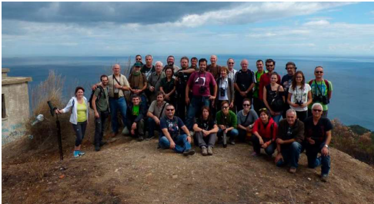
Participantes en el XIX Congreso de Anillamiento Científico de Aves celebrado en Ceuta en octubre de 2015