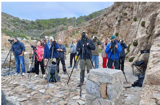
Seguimiento de la migración postnupcial de la pardela cenicienta desde el Desnarigado