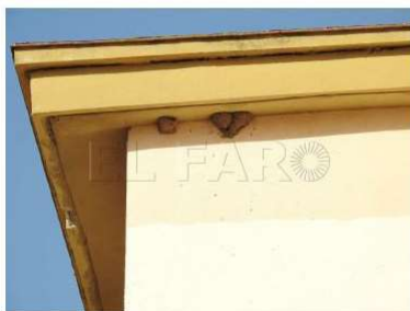
Los nidos se ubican en las cornisas de los edificios.

Guía Verde | 21/06/2017 | Medio Ambiente | 08 |