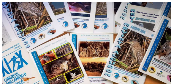
Portadas de diferentes números de la revista Alcudón

Nace con el fin de mantener un canal de información de actividades y de recopilar todos los datos que van surgiendo sobre ornitología y resultados de las distintas campañas y trabajos de investigación. Publicación anual. En el año 2003 se publica el primer número (Nº 0) y en 2024 el número 21, además de un monográfico en el año 2019.