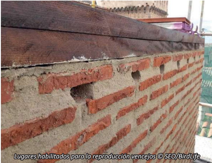
Lugares habilitados para la reproducción vencejos