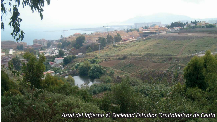
Azud del Infierno