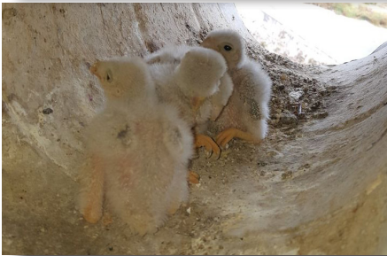
Arriba: Dos imagenes previas de visitas al nido.