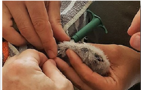
Perforación del patagio.

El presente artículo pretende describir el proceso de colocación de marcas alares en pollos de Cernícalo vulgar.