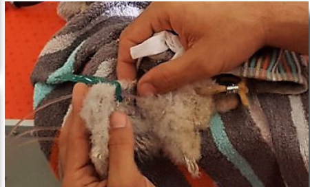
Se pasa el filamento de nylon, por la aguja perforadora, posteriormente se pasa el extremo del filamento por la primera perforación de la marca alar.