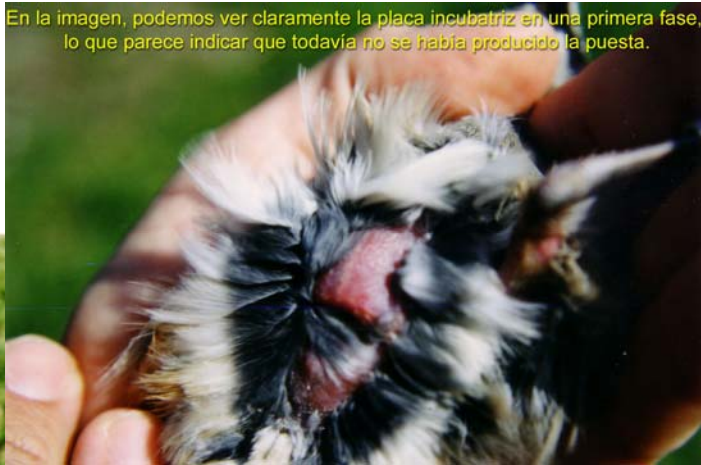
En la imagen, podemos ver claramente la placa incubatriz en una primera fase, lo que parece indicar que todavía no se había producido la puesta.

de anillamiento de Punta Blanca, se capturó para el anillamiento un ejemplar de Chagra que tras ser examinado se comprobó que tenía una placa incubatriz en desarrollo (ver fotografía en página siguiente)