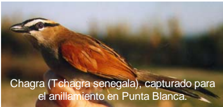
Chagra ( Tchagra senegala ), capturado para el anillamiento en Punta Blanca.

situación al otro lado del Estrecho, en el norte de África, es la que nos hace poseer una pequeña, pero muy valiosa, población de especies y subespecies de aves únicas y prácticamente inexistentes en el resto del territorio nacional, como son el Chagra ( Tchagra senegala ) y el Bulbul naranjero ( Pycnonotus barbatus ) (ver citas homologadas por el comité de rarezas de SEO para todo el estado español), que no ha sido correctamente valorada y reconocida (sirva de ejemplo el último trabajo realizados sobre las aves de España, en el suplemento de la Revista biológica nº 60).